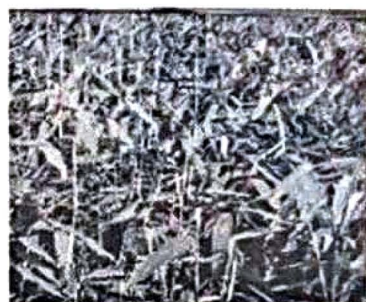
半年生大叶慈竹， 云南龙竹苗