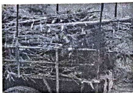
健壮的 1.5 年生龙竹苗