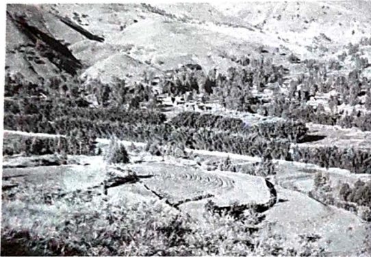
元谋县蜻蛉河竹子绿色长廊