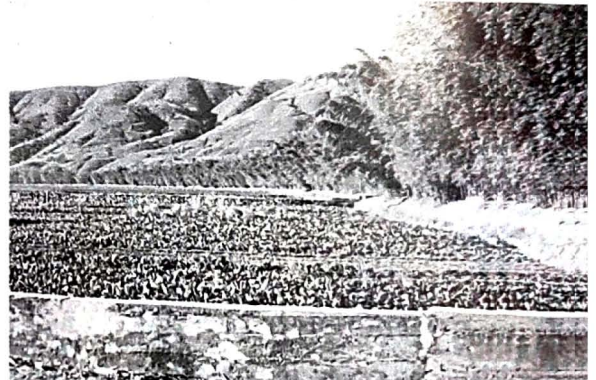
蜻蛉河绵竹绿色长廊保护吨粮田