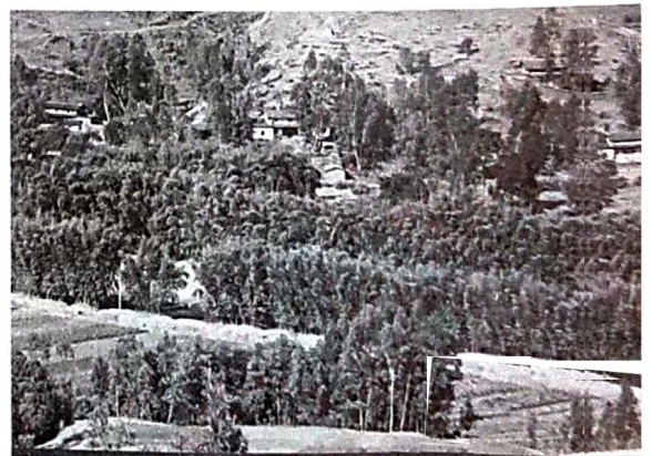
蜻蛉河竹子固土护堤